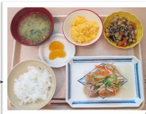
美味しい昼食をご用意しております！

11月4日(水)の昼食です。メニューは、鶏の南蛮漬け・ひじきの煮物・炒り卵・お味噌汁でした。