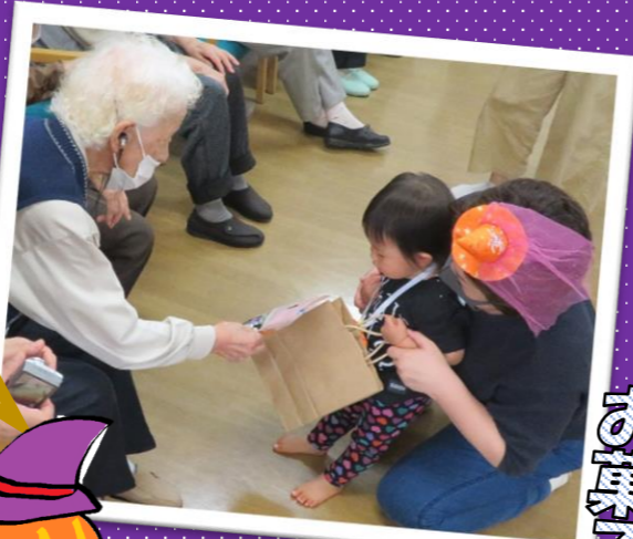
お孫ちゃんにハロウィンカボチャ

令和2年10月22日に「ゆうゆうひろば」の10人の子供たちが、ハロウィンの衣装をして室戸市デイサービスに来てくれました！ 衣装した可愛い子ども達の登場に、利用者の皆さまは大喜びでした。「まあ、見て見て・・・」「かわいい・・・」と目を細め涙ぐむ方も。日頃、一人暮らしの利用者も多く、子ども達との交流で心温まる日になりました。