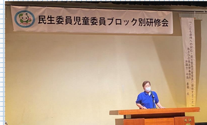
民生委員児童委員ブロック別研修会

令和2年10月16日(金)に東部ブロック民生委員児童委員協議会の全体研修を安芸市民会館で行いました。当日は新型コロナウイルス感染症対策のため、マスク着用、検温、消毒をし、席を空けて座りました。安芸圏域の市町村から142名の民生委員児童委員が参加されました。