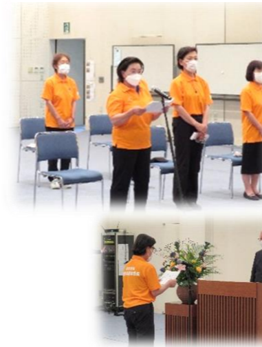
令和4年8月19日に贈呈式を行いました

芸東地区更生保護女性会様より「検温サーモ・自動消毒器」を寄贈していただきました！