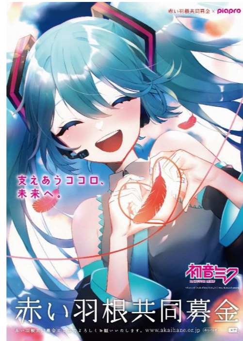
Art by nio © Crypton Future Media, INC. www.piapro.net piapro