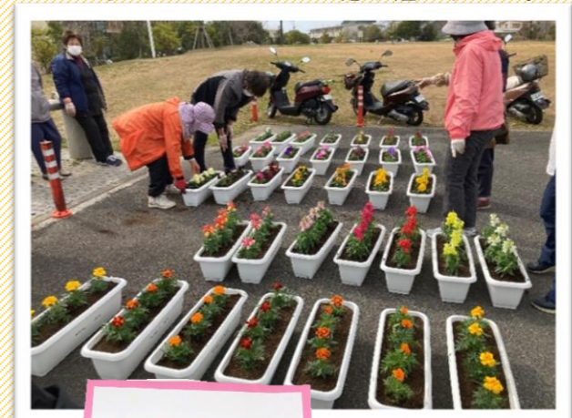
会員が室戸岬の老人憩の家が集まって、たくさんのプランターに花を植えました。