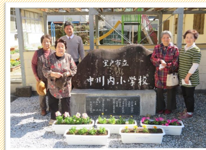
中川内小・中学校は今年で閉校になります。卒業式にお花を贈呈できてよかったです。

学校や保育の行事も中止や人数を制限されて開催されたり、外出もままならない一年でした。子ども達の沈んだ気持ちを少しでも元気にできたらと、「今自分達ができることからはじめよう」とこの活動を行いました。子ども達はコロナに負けないくらいとても元気で、プレゼントしたお花を見て「きれいやね〜」と笑顔に。会員も元気をもらいました。